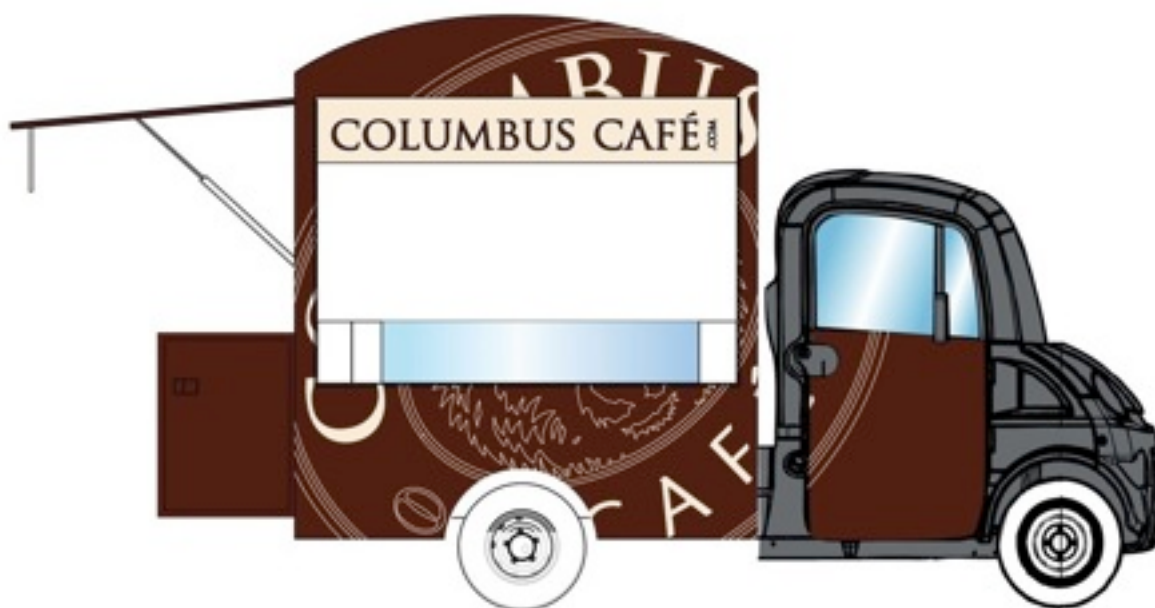
Columbus van électrique