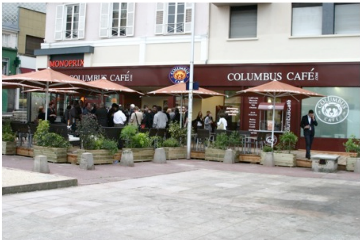
Limoges : 120m2