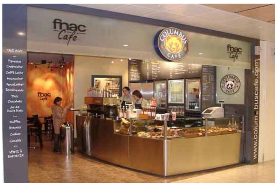
Shop in Shop : 35m2