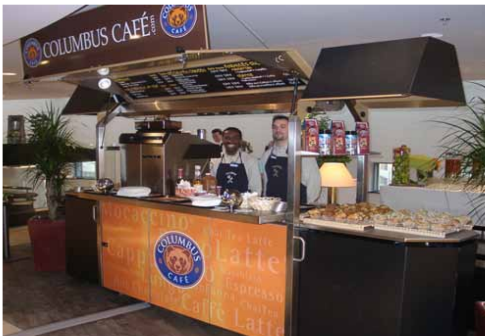
Chariot : 3m linéaire

Un lieu gourmand où la gourmandise est de rigueur. Nos produits sont beaux, bons et simples. Le Barista vend avec le sourire les muffins qu'il a fabriqués. Vous pourrez retrouver Columbus et son accueil dans tous les lieux de vie, l'ours est présent en centre ville, en centres commerciaux, dans les gares, dans les aéroports, dans des Fnac, dans des Leroy Merlin, sur autoroutes...partout où nos clients nous attendent.