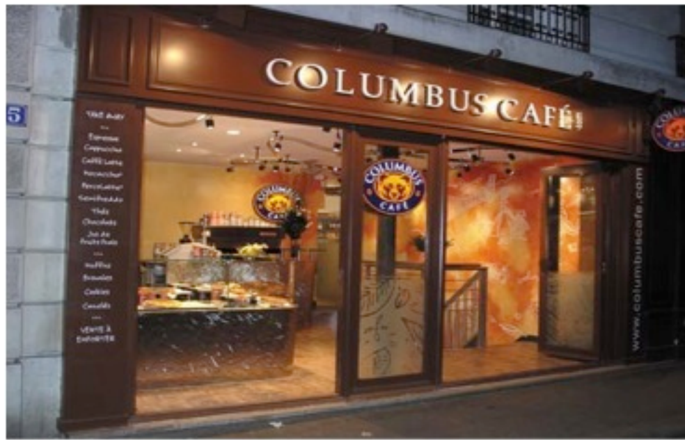
Centre Ville : 70m2